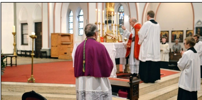
FESTEN FOR APOSTLENE SKT. PETER & PAULUS – 28. JUNI 2020